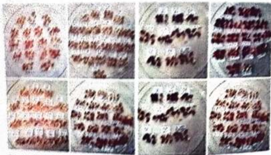
Gambar 2. Hasil analisis kandungan amilopektin dan genotipe jagung lokal generasi BC3(F1). Jagung Lokal Manokwari dan Pulut: (1) Anggi Merah BC3, (2) Anggi Putih BC3, (3) Kebar Merah BC3, (4 & 8) Pulut, (5) Anggi Lokal, (6) Kebar Lokal, dan (7) Prefi Lokal

Genotipe Anggi Merah BC3(F1) endosperminya sudah 117% berwarna orange, diikuti oleh genotipe Anggi Putih BC3(F1) (95,12%) dan Kebar Merah BC3(F1) (74,29%) (Gambar 2). Perentase endosperm yang berwarna orange dari 3 galur harapan jagung ketan lokal Manokwari generasi BC3(F1) dalam penelitian lebih tinggi bila dibandingkan dengan hasil penelitian Suarni (2005) yang mendapatkan hasil yaitu: Srikandi Putih (68,95%), Srikandi Kuning (69,86%), dan Anoman (70,08%). Hal ini menunjukkan bahwa 3 galur harapan jagung ketan lokal Manokwari sudah memiliki kandungan amilopektin yang tinggi.