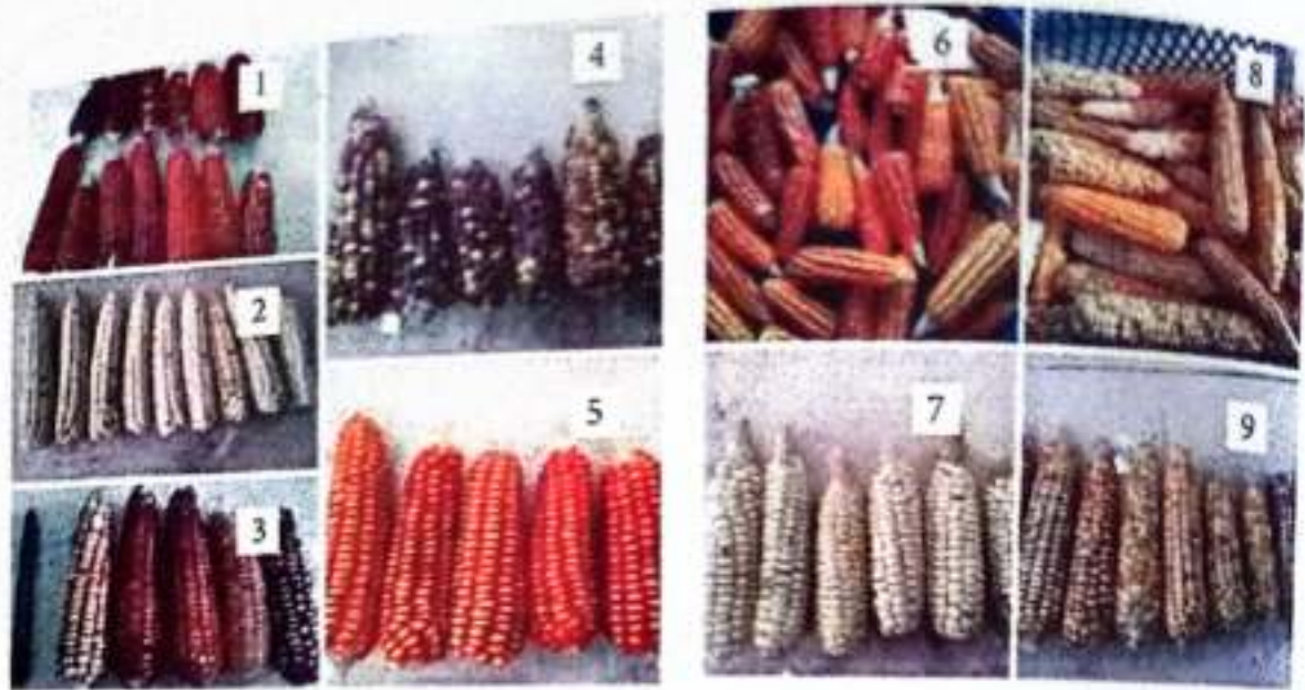
Gambar 1. Profil karakter tongkol dari 7 genotipa jagung: (1) Anggi Merah, BC3, (2) Anggi Putih BC3, (3,7,9) Kebar Merah BC3, (4) Anggi Lokal, (5) Kebar Lokal, (6) Prafi Lokal, (8) Pulut

Tongkol yang memiliki warna biji merah pada hasil penelitian ini dapat digunakan untuk pengembangan varietas jagung ketan lokal Manokwari sumber pangan fungsional karena warna merah pada biji mengandung antioksidan tinggi. Pangan fungsional adalah bahan pangan yang mengandung komponen bioaktif yang memberikan efek fisiologis multifungsi bagi tubuh, antara lain memperkuat daya tahan tubuh, mengatur ritme kondisi fisik, memperlambat penuaan dan membantu mencegah penyakit (Suarni dan Yasin, 2011). Vitamin A atau karotenoid dan vitamin E terdapat pada jagung kuning/merah. Selain fungsinya sebagai zat gizi mikro, vitamin tersebut berperan sebagai antioksidan alami yang dapat meningkatkan imunitas tubuh dan menghambat kerusakan degenerative sel.