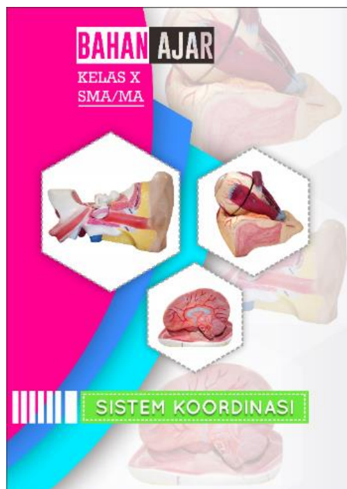
Gambar 1. Sampul Depan Bahan Ajar