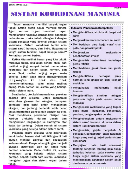
Gambar 2. Halaman Awal Bahan Ajar