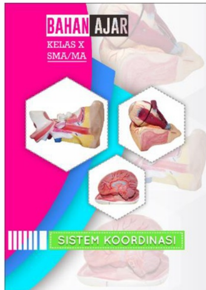
Gambar 1. Sampul Depan Bahan Ajar