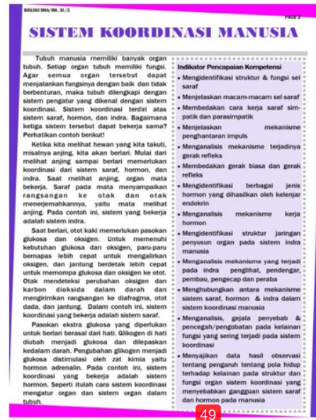
Gambar 2. Halaman Awal Bahan Ajar