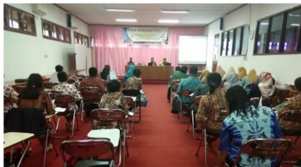
Gambar 2. Pelaksanaan Kegiatan Pelatihan PTK

Pelatihan diawali dengan kegiatan pembukaan oleh Dekan FKIP UNIPA dilanjutkan dengan sambutan oleh ketua panitia dan pemaparan materi oleh tim PKM sebagai narasumber. Materi yang disampaikan dalam pelatihan ini yaitu tentang definisi dan hakikat PTK dibandingkan dengan penelitian lainnya, bidang garapan PTK, model-model PTK, mengidentifikasi permasalahan dalam PTK, judul PTK, teknik pengumpulan data PTK, analisis dan pelaporan hasil PTK. Pemaparan materi dilakukan melalui metode ceramah, diskusi, dan demonstrasi. Setelah pemaparan materi, selanjutnya peserta dilatih untuk menyusun perangkat PTK sebagaimana ditunjukkan pada Gambar 2. Sasaran utama kegiatan ini yaitu guru-guru diharapkan terampil dalam melakukan PTK. Pelaksanaan PTK perlu melibatkan berbagai pihak diantaranya yaitu pihak kampus atau dosen sebagai ahli dan pihak sekolah dalam hal ini guru sebagai praktisi. Kerjasama yang baik antara sekolah dengan pihak kampus dalam hal ini guru dengan dosen, dapat menjadi sarana yang efektif dalam mendiskusikan masalah belajar peserta didik untuk secara bersama dicarikan solusinya (Buaraphan, 2016). Penyelesaian masalah belajar peserta didik perlu dicarikan solusi yang tepat agar hasil belajar yang diharapkan dapat dicapai sesuai dengan tujuan pembelajaran. Gambar 2 memperlihatkan proses pelaksanaan pelatihan.