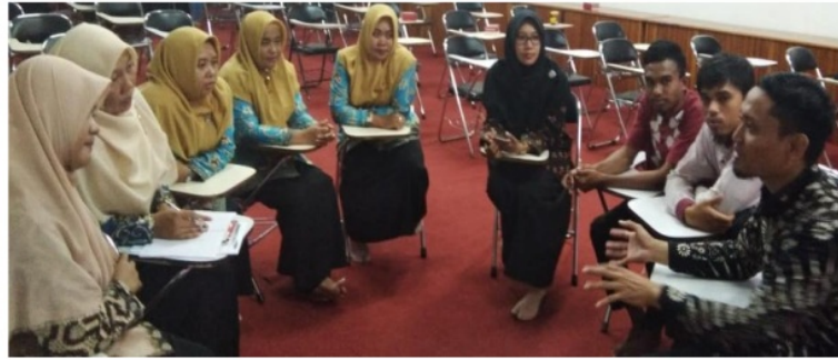
Gambar 3. Small Group Discussion Membahas Permasalahan dan Persiapan Pelaksanaan PTK

Gambar 3 menunjukkan pemateri dan peserta pelatihan saling berdiskusi dan memberikan ide tentang proses pelaksanaan PTK. Setelah kegiatan, mereka diberi angket untuk mengetahui respon mereka. Hasil analisis person reliability diperoleh 0,78 kategori cukup, yang menunjukkan bahwa konsistensi pilihan peserta pelatihan PTK cukup baik. Nilai item reliability diperoleh 0,91 kategori baik sekali, menunjukkan bahwa kualitas item yang digunakan dalam pelatihan baik sekali. Hasil analisis respon peserta pelatihan terhadap pelaksanaan PTK ditunjukkan pada Gambar 4.