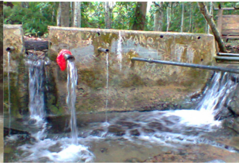
Gambar 3. Pemanfaatan mata air Figure 3. The springs utilization