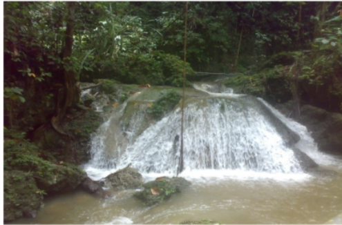
Gambar 2. Air terjun alami Figure 2. Natural waterfall