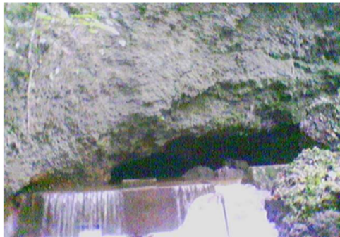
Gambar 4. Goa dan air terjun Figure 4. Cave and waterfall