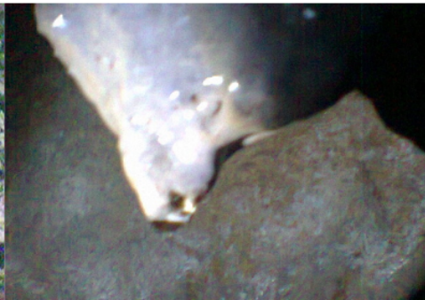
Gambar 5. Stalagmit pada goa Figure 5. Stalagmites in the cave