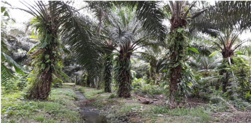
Gambar 2 Parit di antara tanaman sawit pada DAS Arui.

Berdasarkan Tabel 1 simulasi hasil rancangan plb dengan kedalaman 1 m dan curah hujan 42 mm, maka air tertampung semua. Akan tetapi, pada curah hujan sangat lebat, antara 100 mm dan 150 mm, daya tampung plb ukuran 1 m x 1 m x 8 m dan 1 m x 1 m x 9