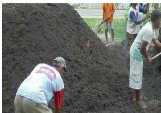
Gambar 5 Pupuk organik (kompos).