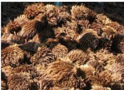
Gambar 4 Tandan kosong sawit.