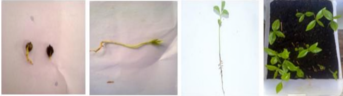
Gambar 1. Morfologi kecambah dan semai A. malaccensis

Aquilaria malaccensis untuk berkecambah pada tiga komposisi media perkecambahan disajikan pada Tabel 3.