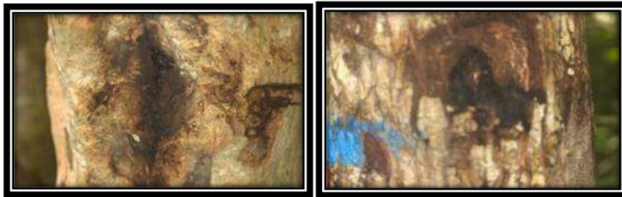
Gambar 2. Sarang Pada Pohon Inang Intsia sp. dan Callophyllum Inophyllum .

pohon Intsia sp. pada saat pohon inang tersebut sedang mengeluarkan cairan pada bagian kulit kayu yang sudah terpotong. Sedangkan pada jenis pohon Vatica rassak lebah membuat sarang pada lubang alami yang sedikit kering. Di alam lebah tinggal pada lobang-lobang pohon, batu karang, dibawah batu, celah-celah dinding rumah dan tembok-tembok pagar. Di hutan, koloni lebah bersarang di pohon-pohon yang berlubang. Lebah kelulut bersarang pada kondisi yang tidak terlalu panas oleh terik matahari, bebas dari kedinginan dan percikan air hujan serta tempat terbaik untuk melindungi dirinya dari serangan musuh.