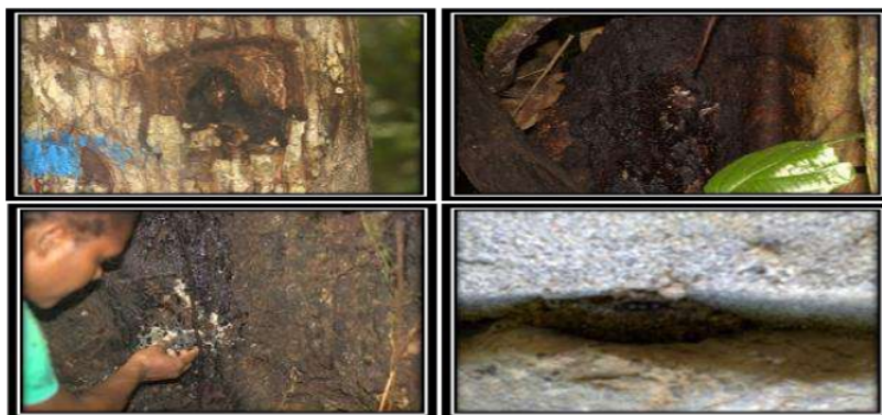
Gambar 3. Sarang Trigona spp. Pada Pohon Inang dan batu.

Letak sarang lebah kelulut selain pada lubang-lubang pohon, juga terdapat pada lapisan terluar kulit pohon inang, seperti pada pohon Intsia sp. dan Callophyllum Inophyllum . Lebah kelulut terlihat lebih aktif pada pohon inang yang banyak mengeluarkan getah. Namun lebah kelulut juga membuat sarang di dinding/tembok rumah dengan komponen sarang ampas-ampas kayu, tanah sedikit berpasir. Gambar sarang dapat dilihat pada gambar 3.