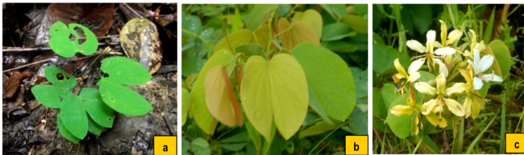
Gambar 3. Karakteristik morfologi jenis B. acuminata ; a. anakan; b. daun; c. bunga

Pengamatan asosiasi tali kupu-kupu dan pohon inang hanya dilakukan pada sepuluh jenis pohon yang paling dominan pada lokasi penelitian. Dari hasil penelitian diketahui bahwa jenis pohon inang yang ditumbuhi tali kupu-kupu sebanyak 10 pohon atau 9,52 %. Famili yang dominan adalah Sapindaceae dengan total individu 17, marga dominan adalah Pometia , sedangkan jenis yang dominan atau paling banyak berasosiasi dengan tali kupu-kupu adalah P. pinnata dengan 11 individu. Hal ini sesuai dengan pendapat Richard (1975) dan Ewusie (1990) yang menyatakan bahwa umumnya di daerah tropis pohon-pohon dalam hutan ditumbuhi liana yang hidupnya menempel pada pohon inang yang menjulur hingga ke tajuk pohon. Jenis-jenis pohon inang yang ditumbuhi oleh tali kupu-kupu ( B. acuminata ) secara lengkap dapat dilihat pada tabel 2.