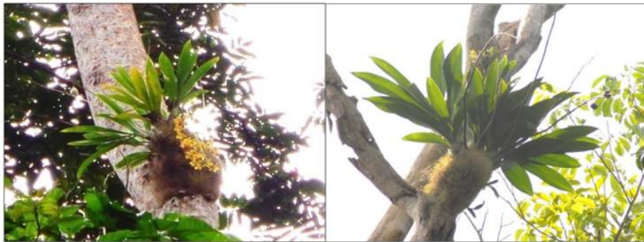
Gambar 2. (sisi kiri) Anggrek Grammatophyllum scriptum Blume yang tumbuh pada batang Pometia coreacea Radlk; (sisi kanan) Anggrek Grammatophyllum scriptum Blume yang tumbuh pada cabang Pometia coreacea Radlk.

Hasil penelitian menunjukkan bahwa jumlah anggrek yang terdapat pada cabang lebih banyak jika dibandingkan dengan yang terdapat pada batang. Hal ini disebabkan karena cabang lebih banyak mendapat cahaya matahari dari pada batang dan juga pada cabang banyak dikunjungi oleh burung yang merupakan salah satu faktor penyebar anggrek itu