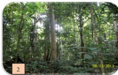
Gambar 3. Pertumbuhan tegakan yang sedang terjadi di hutan sekunder