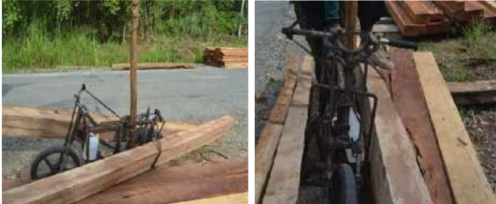
Gambar 2. Pengangkutan sortimen kayu balok menggunakan sepeda.