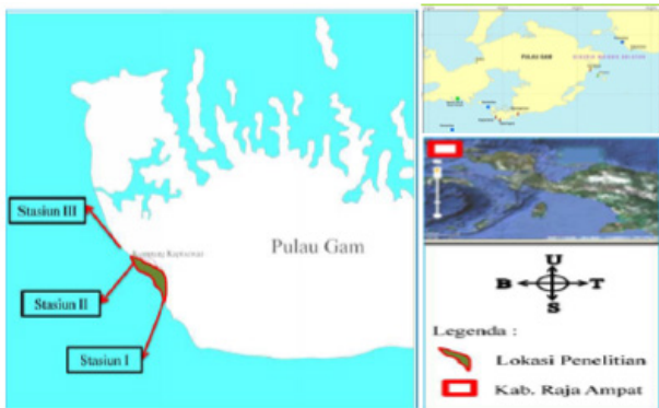
11 Gambar 1. Peta lokasi penelitian.

sumberdaya perairan UNIPA. Identifikasi dilakukan berdasarkan anatomi dan morfologi teripang, dengan cara mengamati bentuk, warna tubuh, bentuk serta komposisi spikula dari jaringan integumen bagian dorsal. Pengamatan bentuk dan komposisi spikula teripang dilakukan dengan cara memotong daging teripang dengan ketebalan 1-2 cm, kemudian direndam dalam larutan pemutih baju selama 5-10 menit, selanjutnya diamati dibawah mikroskop binokuler.