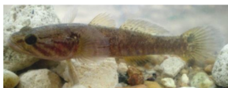
Gambar 3. Oxyeleotris fimbriata (Eleotridae)