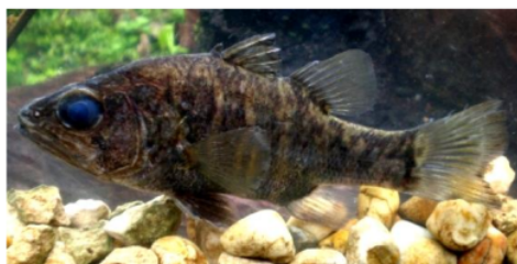
Gambar 2. Glossamia aprion (Apogonidae)