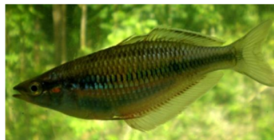
Gambar 5. Melanotaenia irianjaya (Melanotaeniidae)