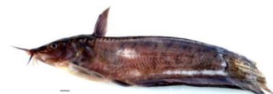
Gambar 6. Neosilurus brevidorsalis (Plotosidae)