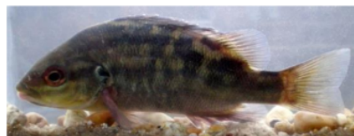
Gambar 4. Hephaestus lineatus (Terapontidae)