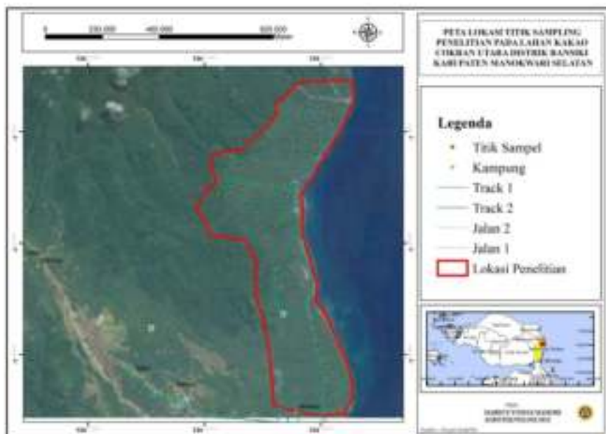
Gambar 2. Sebaran titik sample di lokasi penelitian