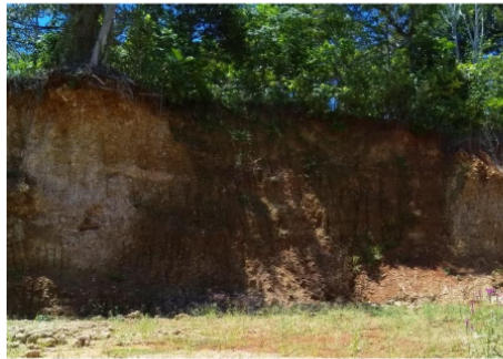
Gambar 7. Pengambilan galian C dan sebagian lahan telah menjadi datar Figure 7. Excavation C and part of the land has become flat

Dampak pengambilan tanah dan galian C daerah resapan air menjadi hilang sehingga meningkatkan risiko bencana longsor dan banjir. Saat hujan air cenderung menjadi limpasan permukaan, mengingat tidak ada vegetasi dan serasah yang menghalangi air. Air akan mengalir mengikuti permukaan tanah yang lebih rendah, mungkin akan menyatu, mengikis tanah dan aliran semakin besar. Potensi Longsor akan semakin besar karena lahan semakin curam sebagai dampak penggalian tanah pada lahan yang agak miring, sehingga lahan yang ditinggalkan semakin curam (Gambar 7)