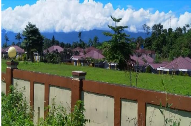
Gambar 9. Kawasan terbangun di HLWR Figure 9. Built area in PFWR

Seharusnya alih fungsi dan perubahan penggunaan lahan pada hutan lindung sedini mungkin harus dihindari, karena bisa menimbulkan banjir bahkan banjir bandang. Menurut Kompas (2021) perubahan tata guna lahan dan kawasan terbangun yang meningkat di daerah tebing/kawasan curam akan menyumbang potensi banjir di wilayah bawahnya seperti daerah hilir. HLWR yang berdekatan dengan jalan provinsi/protokol yang menghubungkan 3 kabupaten pemekaran membuat incaran untuk dijadikan pemukiman, tempat usaha dan kawasan terbangun lainnya (Gambar 9). Menurut Narindrani (2018) aktifitas perambahan sumber daya hutan dan pemanfaatan hasil hutan memberikan dampak terhadap lingkungan. Perambahan hutan pada kawasan hutan lindung sedini mungkin harus dicegah, dengan sosialisasi baik melalui penyuluhan dan pemasangan papan larangan. Upaya pemerintah melalui Kementerian Lingkungan Hidup dan Kehutanan (KLHK) bersama Polri dan TNI angkatan laut untuk mengatasi perambahan hutan telah dibentuk tim penanggulangan peredaran hasil hutan tidak syah, penebangan liar dan menggalakan operasi wanalaga & wahana bahari untuk menangkal pembalakan liar. Agar pembalakan liar berkurang pemerintah mengeluarkan Instruksi Presiden No. 4 Tahun 2005 tentang pemberantasan penebangan kayu secara tidak syah di kawasan hutan dan peredarannya di Indonesia bertujuan untuk menangani pembalakan liar.