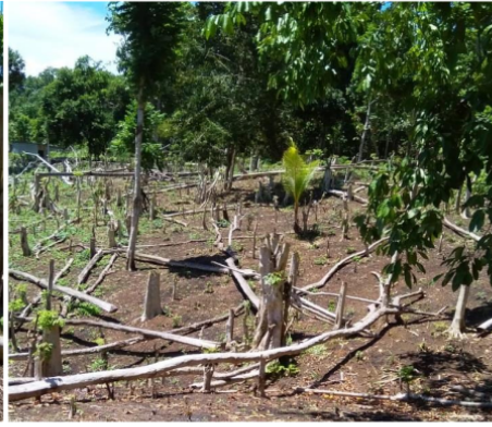
Gambar 6. Batang, cabang nampak berserakan dan lahan kosong dari rumput Figure 6. Stem, branches appear scattered and the land is empty of litter