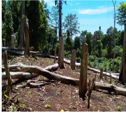
Gambar 5. Hutan ditebang dengan cara dibakar untuk buka lahan baru Figure 5. Forests are cut down by burning to open new land