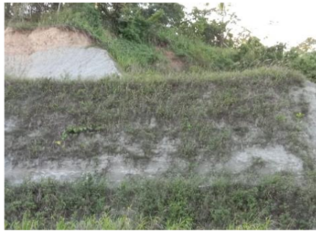
Gambar 8. Pengambilan tanah dan permukaan tanah dibuat seperti tangga Figure 8. Soil Excavation and the ground surface is made like a ladder

Dari gambar 8 menunjukkan bekas galian telah ditinggalkan, lahan menjadi sangat curam dan sementara bagian bawah menjadi datar. Jika hujan intensitas tinggi lahan dengan posisi sangat curam, maka sangat berpotensi longsor karena saat hujan lahan yang sangat curam beban sangat berat dan tidak seperti biasanya. Biasanya lahan tersebut ada penahan galian C/ galian batuan, mengingat lahan bagian bawah dikeruk/dipotong untuk diambil maka lahan yang ditinggalkan semakin curam. Menurut Hardiyatmo (2012) semakin curam lahan kekuatan menahan tanah semakin kecil, padahal beban tanah tetap. Apabila beban tanah semakin besar akibat air masuk kedalam tanah yang berasal dari curah hujan tinggi, maka beban tanah semakin besar. Padahal kekuatan lahan bagian kelerengan curam relatif sama, baik terdapat air maupun tidak. Dengan demikian permukaan tanah yang digali untuk dibuat semakin curam potensi longsor akan semakin besar.