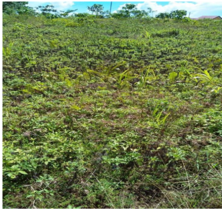
Gambar 2. Lahan kritis pada kawasan HLWR Figure 2. Critical land in the PFWR area

Bagaimana tidak terjadi longsor jika hutan lindung dengan kelerengan curam/ sangat curam dan intensitas hujan sangat tinggi yang tadinya penuh dengan vegetasi, akan tetapi pohon dibabat habis baik untuk pertanian dan pemukiman. Sementara itu kawasan pertanian pada kelerengan curam/ sangat curam jika terjadi hujan air dengan mudah mengikis tanah, karena tipe daun yang berbeda dengan tanaman kehutanan dan setelah panen biasanya lahan kosong dari vegetasi. Lahan kosong/lahan bera tidak ada yang mengikat tanah, air hujan yang tadinya meresap menjadi aliran permukaan dan aliran permukaan semakin besar akan timbul erosi alur/parit yang akan memperbesar partikel tanah untuk berpindah dalam jumlah besar (longsor).