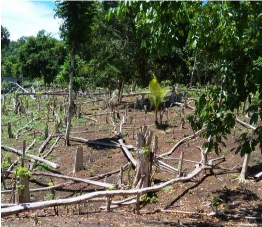
Gambar 6. Batang, cabang nampak berserakan dan lahan kosong dari rumput Figure 6. Stem, branches appear scattered and the land is empty of litter