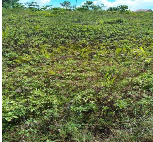
Gambar 2. Lahan kritis pada kawasan HLWR Figure 2. Critical land in the PFWR area

Bagaimana tidak terjadi longsor jika hutan lindung dengan kelerengan curam/ sangat curam dan intensitas hujan sangat tinggi yang tadinya penuh dengan vegetasi, akan tetapi pohon dibabat habis baik untuk pertanian dan pemukiman. Sementara itu kawasan pertanian pada kelerengan curam/ sangat curam jika terjadi hujan air dengan mudah mengikis tanah, karena tipe daun yang berbeda dengan tanaman kehutanan dan setelah panen biasanya lahan kosong dari vegetasi. Lahan kosong/lahan bera tidak ada yang mengikat tanah, air hujan yang tadinya meresap menjadi aliran permukaan dan aliran permukaan semakin besar akan timbul erosi alur/parit yang akan memperbesar partikel tanah untuk berpindah dalam jumlah besar (longsor).