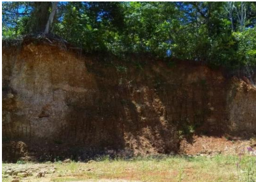
Gambar 7. Pengambilan galian C dan sebagian lahan telah menjadi datar Figure 7. Excavation C and part of the land has become flat

Dampak pengambilan tanah dan galian C daerah resapan air menjadi hilang sehingga meningkatkan risiko bencana longsor dan banjir. Saat hujan air cenderung menjadi limpasan permukaan, mengingat tidak ada vegetasi dan serasah yang menghalangi air. Air akan mengalir mengikuti permukaan tanah yang lebih rendah, mungkin akan menyatu, mengikis tanah dan aliran semakin besar. Potensi longsor akan semakin besar karena lahan semakin curam sebagai dampak penggalian tanah pada lahan yang agak miring, sehingga lahan yang ditinggalkan semakin curam (Gambar 7)