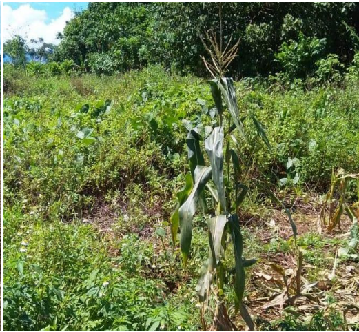
Gambar 4. Lahan bera dan tanaman Jagung Figure 4. Bera land and corn plant

Shifting cultivation dengan membakar tidak semata-mata kembali ke lahan yang telah dan sedang ditinggalkan tetapi berpindah dari lahan yang baru dengan cara membuka hutan. Mereka meyakini dengan membakar dan berpindah-pindah tanaman lebih subur walaupun tidak dipupuk. Memang masyarakat asli Papua tidak mengenal pupuk dalam setiap bercocok tanam. Beberapa masyarakat mempunyai anggapan/ indikator jika tumbuh tumbuhan tertentu maka bisa berpindah ke lahan yang dulu ditinggalkan/lahan bera (Gambar 4). Berdasarkan Gambar 4 nampak tanaman jagung, sedangkan disampingnya terdapat lahan bera yang ditumbuhi rumput dan semak belukar. Dampak dari pengetahuan yang rendah terhadap manfaat hutan lindung mendorong petani untuk melakukan perluasan dengan terus berpindah dari lahan/hutan yang lain. Mereka tidak menyadari perladangan berpindah berdampak perluasan lahan bera dan lahan kritis. Menurut Dako et al. (2019) perambahan liar hutan lindung untuk perladangan memberikan dampak seperti lahan kritis seluas 138,9 ha di Provinsi NTT.