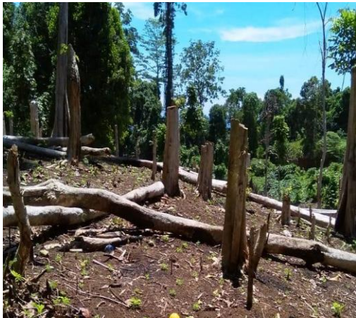
Gambar 5. Hutan ditebang dengan cara dibakar untuk buka lahan baru Figure 5. Forests are cut down by burning to open new land

berpindah suku Wemale di Ambon, dengan jenis tanaman pisang, umbi-umbian, sayuran, cabai dan tomat untuk dapat dijual ke pasar agar dapat menghasilkan uang bagi kebutuhan pendidikan anak (Matinahoru 2013). Padahal jika hutan lindung beralih fungsi menjadi lahan pertanian berpotensi menjadi longsor dan menjadi faktor banjir bandang sebagaimana banjir bandang di Malang. Menurut Tempo (2021) berubah fungsi hutan lindung (lokasi curam dan kemiringan tajam) menjadi lahan pertanian dengan komoditas hortikultura seperti: kentang, daun bawang, kol, dan wortel yang berlangsung beberapa tahun diduga menjadi penyebab banjir bandang di Kota Batu.