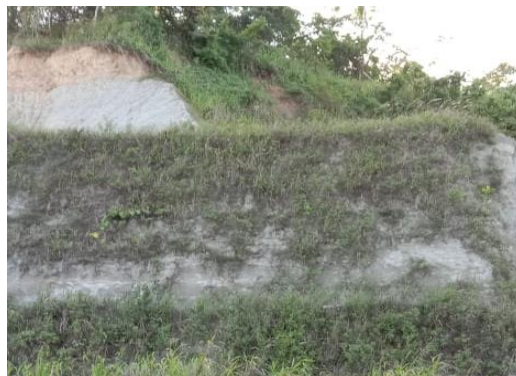
Gambar 8. Pengambilan tanah dan permukaan tanah dibuat seperti tangga Figure 8. Soil Excavation and the ground surface is made like a ladder

Dari gambar 8 menunjukkan bekas galian telah ditinggalkan, lahan menjadi sangat curam dan sementara bagian bawah menjadi datar. Jika hujan intensitas tinggi lahan dengan posisi sangat curam, maka sangat berpotensi longsor karena saat hujan lahan yang sangat curam beban sangat berat dan tidak seperti biasanya. Biasanya lahan tersebut ada penahan galian C/ galian batuan, mengingat lahan bagian bawah dikeruk/dipotong untuk diambil maka lahan yang ditinggalkan semakin curam. Menurut Hardiyatmo (2012) semakin curam lahan kekuatan menahan tanah semakin kecil, padahal beban tanah tetap. Apabila beban tanah semakin besar akibat air masuk