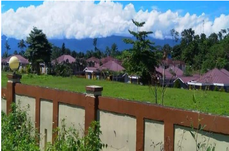
Gambar 9. Kawasan terbangun di HLWR Figure 9. Built area in PFWR

Seharusnya alih fungsi dan perubahan penggunaan lahan pada hutan lindung sedini mungkin harus dihindari, karena bisa menimbulkan banjir bahkan banjir bandang. Menurut Kompas (2021) perubahan tata guna lahan dan kawasan terbangun yang meningkat di daerah tebing/kawasan curam akan menyumbang potensi banjir di wilayah bawahnya seperti daerah hilir. HLWR yang berdekatan dengan jalan provinsi/protokol yang menghubungkan 3 kabupaten pemekaran membuat incaran untuk dijadikan pemukiman, tempat usaha dan kawasan terbangun lainnya (Gambar 9). Menurut Narindrani (2018) aktifitas perambahan sumber daya hutan dan pemanfaatan hasil hutan memberikan dampak terhadap lingkungan. Perambahan hutan pada kawasan hutan lindung sedini mungkin harus dicegah, dengan sosialisasi baik melalui penyuluhan dan pemasangan papan larangan. Upaya pemerintah melalui Kementerian Lingkungan Hidup dan Kehutanan (KLHK) bersama Polri dan TNI angkatan laut untuk mengatasi perambahan hutan telah dibentuk tim penanggulangan peredaran hasil hutan tidak syah, penebangan liar dan menggalakan operasi wanalaga & wahana bahari untuk menangkal pembalakan liar. Agar pembalakan liar berkurang pemerintah mengeluarkan Instruksi Presiden No. 4 Tahun 2005 tentang pemberantasan penebangan kayu secara tidak syah di kawasan hutan dan peredarannya di Indonesia bertujuan untuk menangani pembalakan liar.