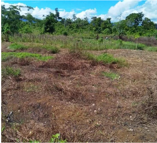
Gambar 3. Lahan bekas bakar yang siap untuk diolah Figure 3. Burnt used land ready to be processed

Adat istiadat/ budaya perladangan berpindah dengan membakar telah menjadi tradisi turun temurun yang dianut oleh masyarakat di Tanah Papua (Gambar 3). Padahal kalau tidak dibakar serasah yang berasal dari bunga, buah, ranting, cabang dan batang akan mengurangi aliran permukaan saat intensitas hujan tinggi. Menurut Masnang et al. (2014) jika terjadi penurunan serasah atau material lain, maka saat terjadi hujan aliran permukaan dan sedimen akan terjadi peningkatan. Hasil wawancara mengungkapkan semua responden mengatakan bahwa kegiatan perladangan berpindah dengan membakar terjadi hampir seluruh tanah di HLWR dan menjadi budaya yang diturunkan oleh nenek moyang sampai sekarang. Menurut Ataribaba et al.(2020) perladangan berpindah merupakan kearifan tradisional untuk menjaga ketahanan pangan lokal yang sudah melembaga dan membudaya pada suku-suku di Papua.