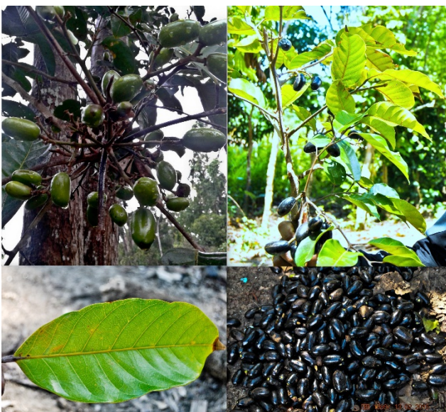
Gambar 2. Buah hitam ( Haplolobus monticola ).

dijumpai pada sebagian besar daerah tropis dan sub tropis (Gambar 1).