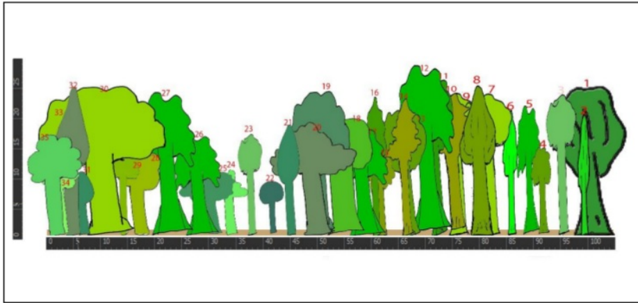
Gambar 3. Diagram Profil Tegakan pada Habitat F. pimentelliana F. v. Muell di Kawasan Hutan Bembab Kabupaten Manokwari Selatan

tegakan pada habitat F. pimentelliana F. v. Muell di kawasan hutan Bembab Kabupaten Manokwari Selatan adalah sebagai berikut :