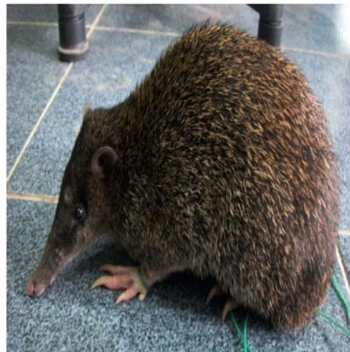
Gambar 1. Echymipera kalubu jantan

Bandikut ( Echymipera kalubu ) yang digunakan dalam penelitian ini (Gambar 1) termasuk dalam famili Peroryctidae dan genus Echymipera . Merupakan Peroryctidae yang paling banyak dan tersebar merata di Papua, yang hidup di daerah padang rumput hutan terbuka, kebun dengan ketinggian 2000 meter dari permukaan laut (Petocz, 1994). Bandikut adalah hewan mirip dan berukuran seperti tikus dengan panjang tubuh dapat mencapai 40 cm. mempunyai ekor pendek dengan panjang sepertiga panjang tubuh atau sebagian tidak memiliki ekor. Kepala bandikut sempit dan meruncing mengarah ke hidung yang panjang, memiliki rambut yang kaku berwarna coklat muda sampai coklat tua dengan campuran warna kuning dan hitam pada bagian ujungnya, bagian bawah berwarna kuning gading, hanya terdapat empat gigi seri atas (Menzies, 1991).