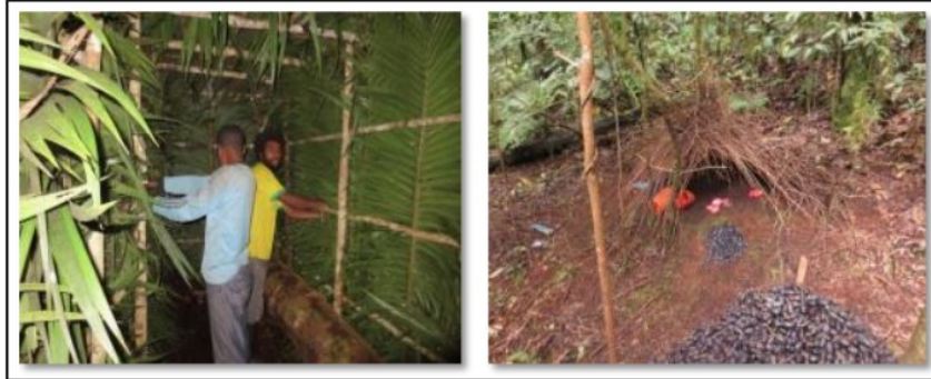
Gambar 6. Pondok Kamufase dan Sarang Burung.