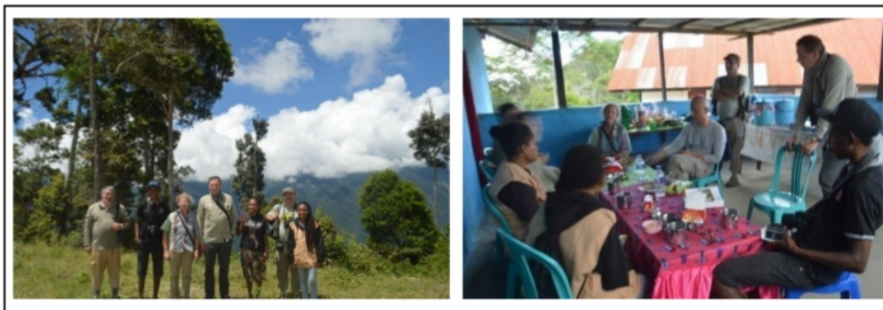
Gambar 7. Pendampingan Guiding pada Local Guide untuk Tim Tourist mancanegara yang Datang ke Lokasi Cagar Alam Pegunungan Arfak.

mendapat perhatian tersendiri. Belum adanya pelatihan guide membuat keterbatasan-keterbatasan tersebut belum dapat di atasi. Dengan adanya program kerja Guiding ini, diharapkan dapat mengurangi sedikit keterbatasan tersebut. Bentuk dari program ini adalah memberikan contoh pengarahan yang lebih baik kepada Local guide agar proses Guiding berjalan lebih efektif dan edukatif (Gambar 7).