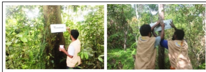
Gambar 2. Pemasangan Papan Zonasi Igya Ser Hanjob Pada Jalur Tracking.

zonasi yang di pasang yaitu Tumti, Bahamti, Nimahanti, dan Situmti. Masing-masing satu papan. Adanya kerjasama yang baik antara tim KKN bersama local guide , yaitu dengan memandu ketempat yang akan dipasang papan zonasi serta informasi mengenai tempat-tempat tersebut sehingga mempermudah pemasangan papan. Zonasi Igya Ser Hanjob merupakan teknik konservasi tradisional yang sudah diterapkan oleh masyarakat Arfak secara turun temurun (Gambar 2).