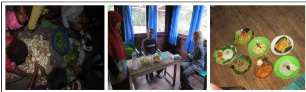
Gambar 4. Demonstrasi Penyiapan dan Penyajian Makanan Bersama Masyarakat (Kiri) dan Kepada Wisatawan di Home Stay (Tengah dan Kanan).

pengelola perlu ditingkatkan lagi, walaupun pada dasarnya masyarakat dikampung Kwau sudah sangat-sangat ramah dan bersahabat dalam hal itu. Namun beberapa contoh seperti penyediaan makanan yang masih ala kadarnya menjadi beberapa faktor alasan dari kegiatan tersebut, jika sudah ditingkatkan maka hal-hal kecil seperti akan mendatangkan profit yang tinggi pula. Program ini menghasilkan adanya pemahaman baru tentang cara pelayanan yang lebih baik kepada para wisatawan. Mulai dari menjaga kebersihan, keindahan, dan kenyamanan para wisatawan. Ketersediaan pengelola untuk mendengar pemaparan tentang hospitality homestay menjadi faktor pendukung yang sangat menunjang program ini. Namun, terdapat pula hambatan berupa banyaknya masyarakat yang kurang mengerti bahasa Indonesia. Namun, hambatan tersebut dapat diatasi dengan adanya penerjemah lokal.