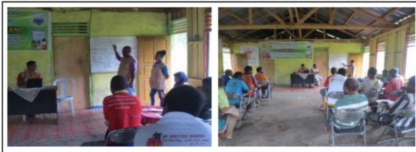
Gambar 5. Pembentukan Badan Pengurus Sanggar Seni Budaya

anggota sanggar tersebut sudah benar-benar siap untuk melakukan pertunjukan seni budaya, dan juga budaya mereka akan tetap terjaga sampai beberapa generasi berikutnya. Pada Gambar 5, telah menghasilkan suatu sanggar yang bernama "Sanggar Kwau Minmo". Keberhasilan program ini di dukung oleh penerimaan masyarakat yang baik melalui pemahaman tentang pentingnya pembentukan Sanggar ini.